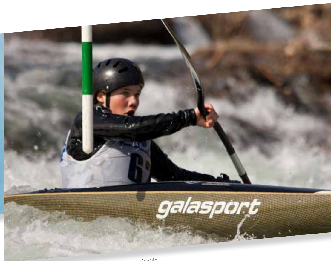
Kayak monoplace dame, bassin de Réals