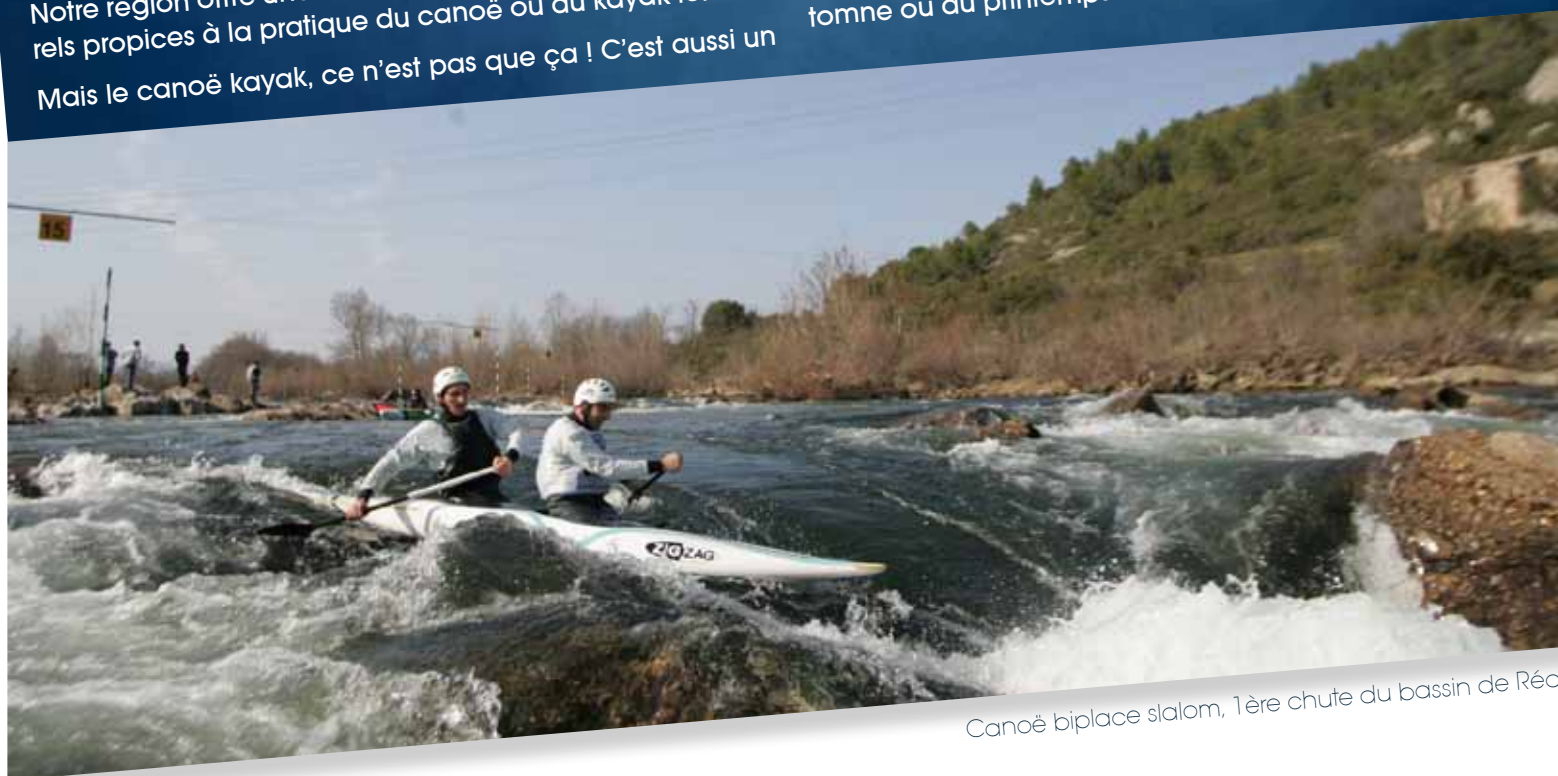
Canoë biplace slalom, 1 ère chute du bassin de Réals

Venez dans un club goûter au plaisir que procure une descente de rivière ou une randonnée en mer à l'automne ou au printemps !