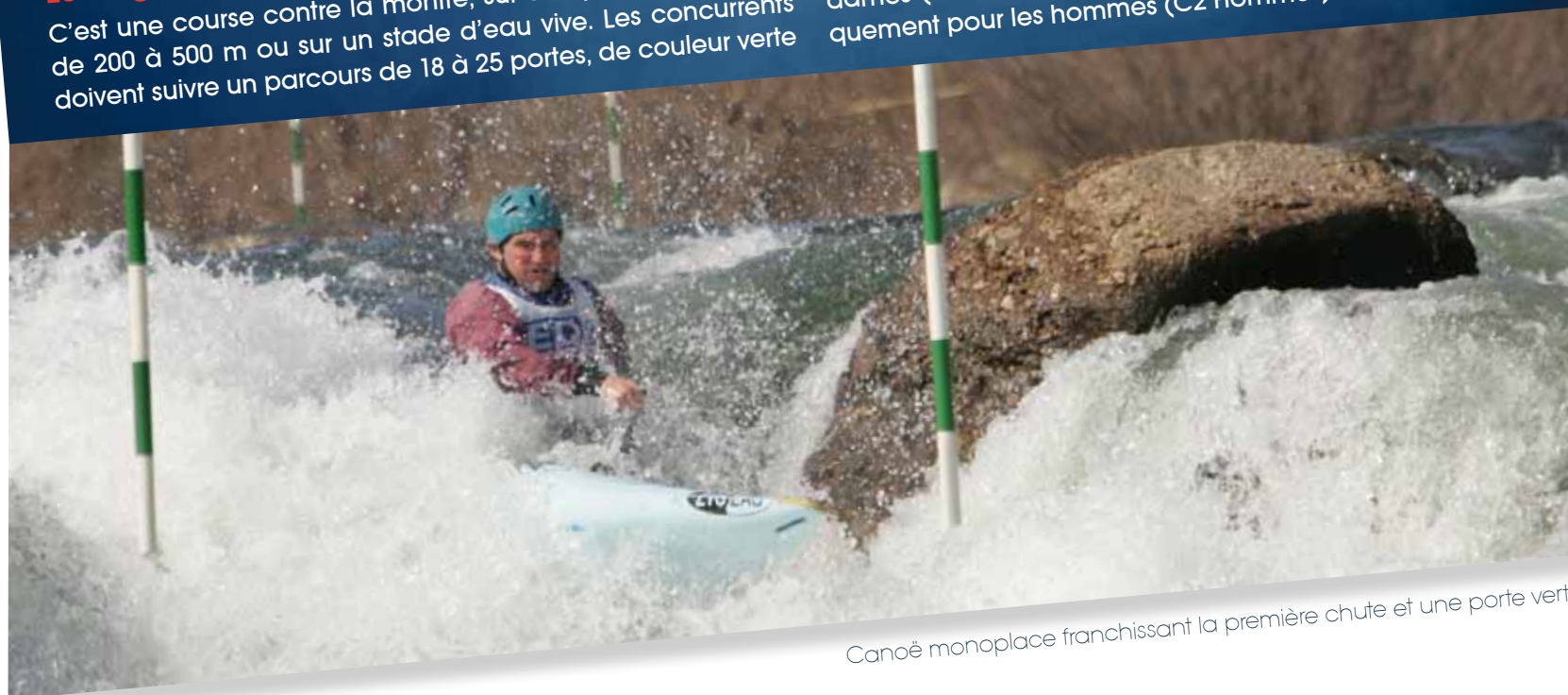
Canoë monoplace franchissant la première chute et une porte verte

Le canoë-kayak comprend 2 types d'embarcations bien distinctes : le canoë (position à genou, propulsé à l'aide d'une pagaie simple) et le kayak (position assise, propulsé à l'aide d'une pagaie double). Ainsi les différentes catégories sont les suivantes : kayak monoplace homme et dame (K1 Hommes, K1 Dames), canoë monoplace homme et dames (C1 Hommes, C1 Dames), et canoë biplace, uniquement pour les hommes (C2 Hommes).